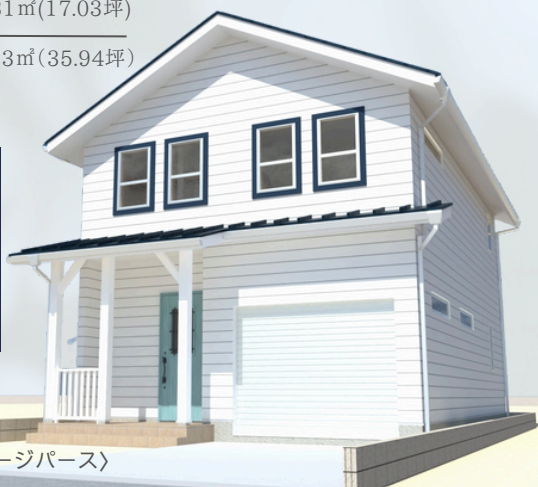
〈建物完成イメージパース〉