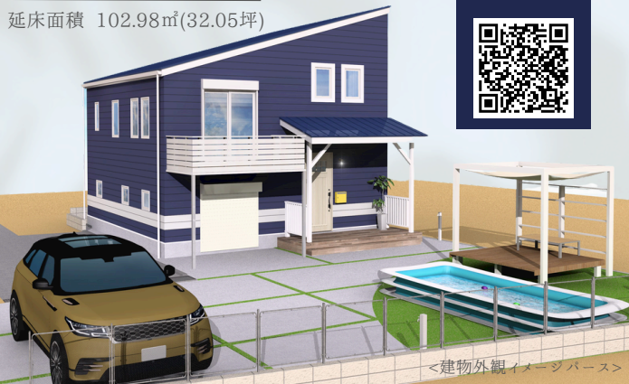
<建物外観イメージバース>